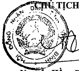
Nguyễn Hồng Diên