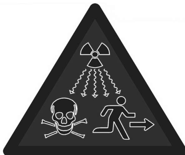
Hình 2. Dấu hiệu cảnh báo bức xạ ion hóa bổ sung sử dụng cho các nguồn phóng xạ thuộc mức an ninh A, B và C

Kích thước, màu sắc của dấu hiệu cảnh báo bức xạ ion hóa bổ sung thực hiện theo Tiêu chuẩn quốc gia TCVN 8663:2011 ISO 21482:2007