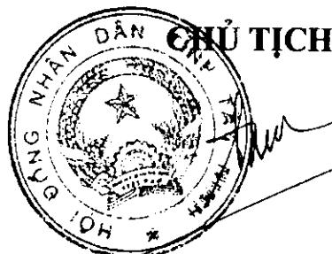
Nguyễn Thành Tâm

b) 50% kinh phí còn lại phân bổ cho các huyện, thành phố được thực hiện theo tiêu chí phân bổ, cách tính điểm và hệ số k và phương pháp tính mức vốn phân bổ cho từng huyện, thành phố theo quy định tại Khoản 3, 4, 5 Điều 7 Quy định này. / uat