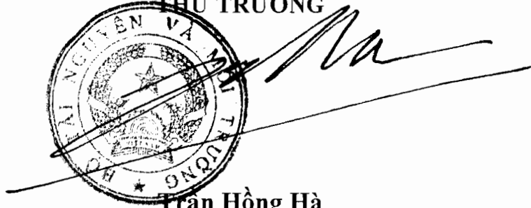
Trần Hồng Hà

KT. BỘ TRƯỞNG Cdu BỘ TÀI NGUYÊN VÀ MÔI TRƯỜNG THỨ TRƯỞNG