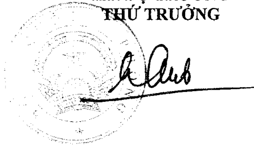
Thượng tướng Phan Văn Giang