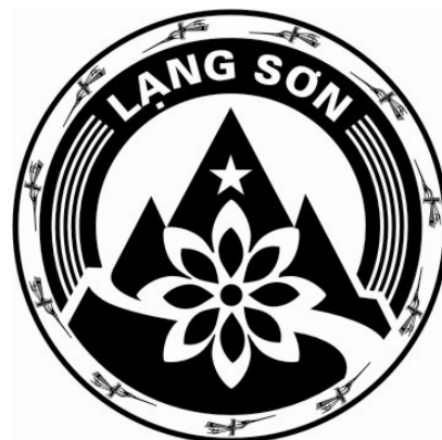
Hình 02. Mẫu biểu trưng in đen trắng