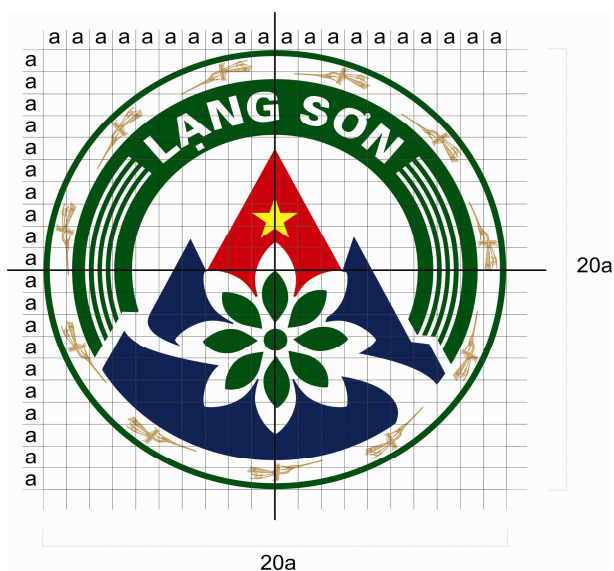
Hình 03. Mẫu Biểu trưng trên lưới tỷ lệ chuẩn

Tỷ lệ kết cấu các phần tử hình khối của Biểu trưng được quy định theo hình mẫu dưới đây: