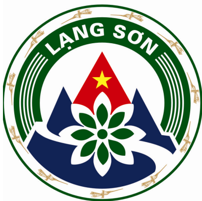
Hình 01. Mẫu biểu trưng in màu

Vòng tròn ngoài cùng mang hình 11 con chim Lạc với ý nghĩa hình chim Lạc là biểu tượng gắn liền với truyền thuyết “Con Lạc cháu Hồng”, với lịch sử truyền thống mấy nghìn năm dựng nước và giữ nước của dân tộc Việt, trong đó có nhân dân các dân tộc tỉnh Lạng Sơn; đồng thời thể hiện số lượng 11 huyện, thành phố của tỉnh. Vòng tròn bao quanh cũng thể hiện ý chí của nhân dân các dân tộc tỉnh Lạng Sơn đoàn kết, chung tay góp sức xây dựng quê hương giàu đẹp.