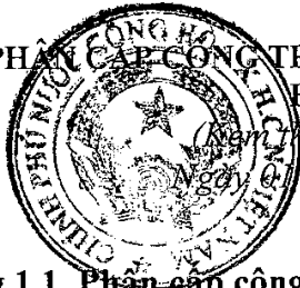
Bảng 1.1. Phân cấp công trình dân dụng