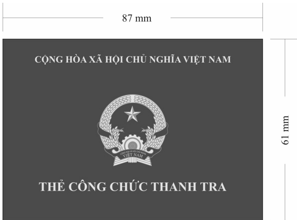
Hình 1. Mặt trước